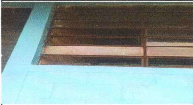
FOTO 1. SE PUEDE OBSERVAR QUE NO SE CUENTA CON BALCONES.